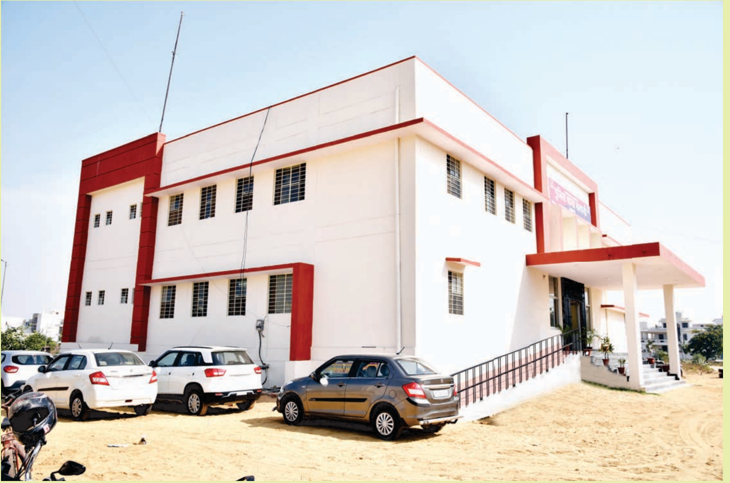
पुलिस थाना भवन करधनी