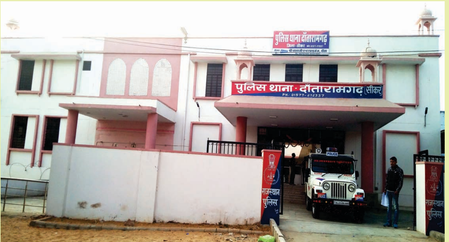
पुलिस थाना भवन दौतारामगढ़