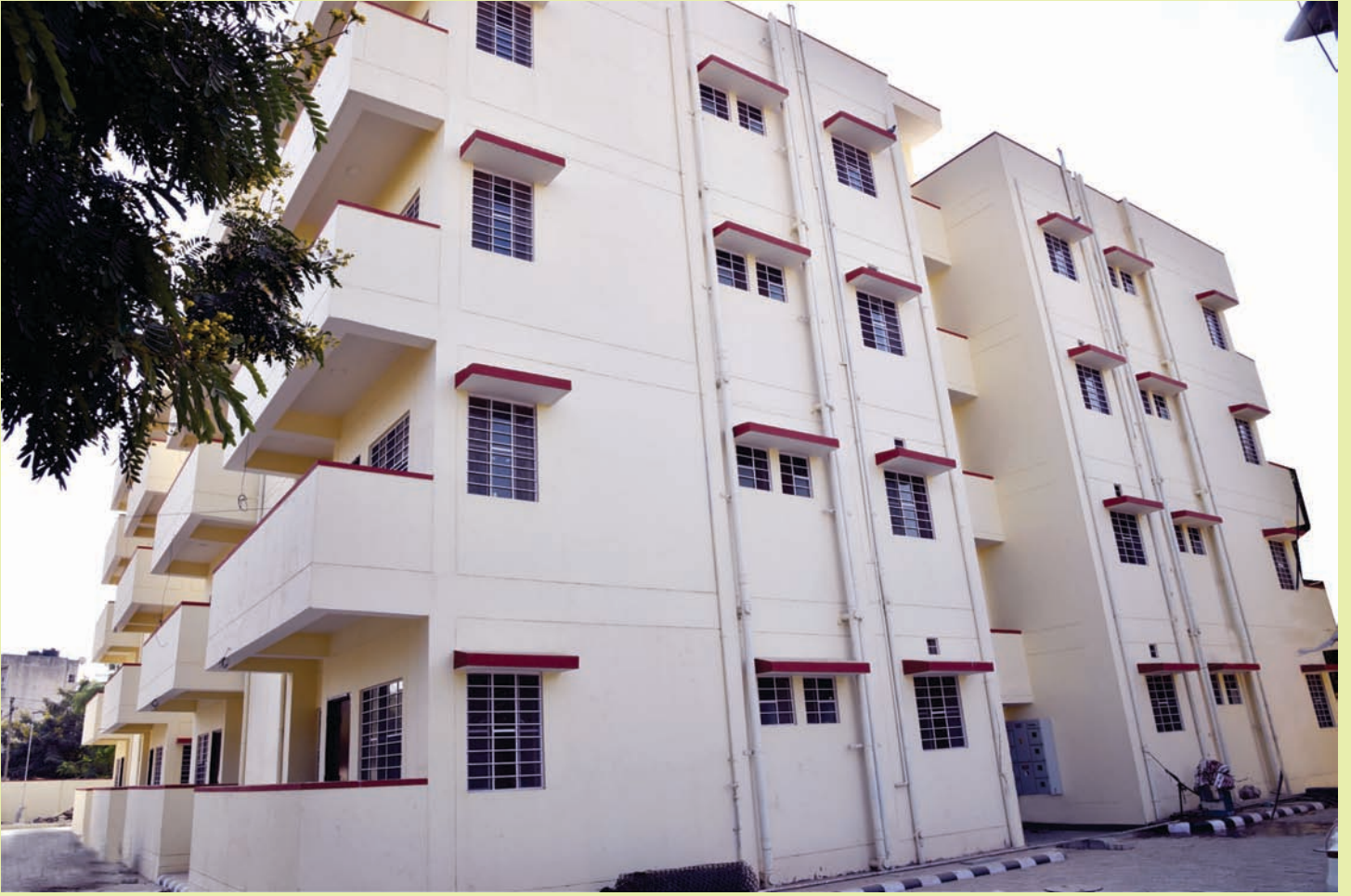
लोअर सर्बोडिनेट आवासीय भवन, शिप्रापथ, जयपुर