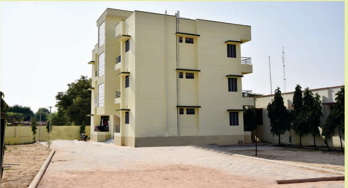
लोअर सर्बोडिनेट आवासीय भवन, कालाडेरा, जयपुर