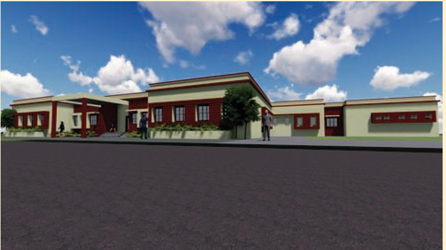
Under construction of 100 men barracks at 14th RAC Pahari, Bharatpur