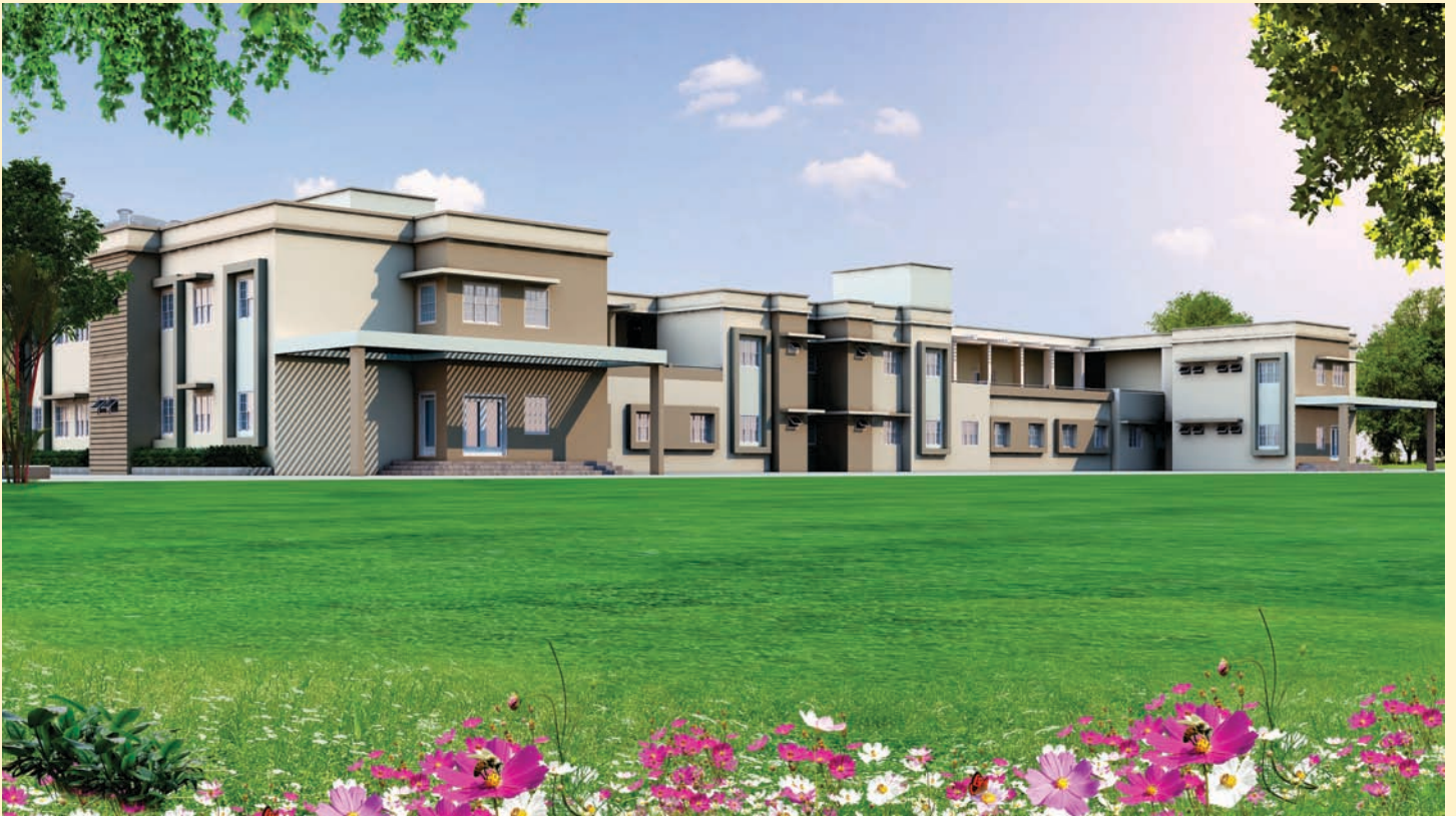
Under construction of Administrative Block at 14th RAC Pahari, Bharatpur